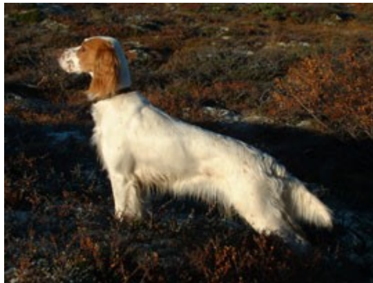
Nesten halvannen meter lang stand

faktisk lik over hele fjøla, alle er best i klassen! Her om dagen sa en hundematselger til meg at hunden ville stå bedre i stand, dette fordi hans hundemat ville gjøre balansen til hunden min bedre, som igjen ville føre til at den sto stødigere og lengre????? Jeg hadde lyst til å spørre han om hvor mange meter lenger hunden min ville stå?